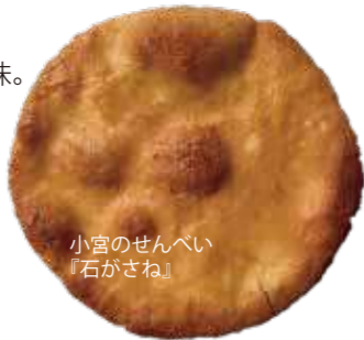
小宮のせんべい「石がさね」

噛めばかむほど味わい深い素材の味。お米と醤油でできたせんべいは日本の味の基本です。